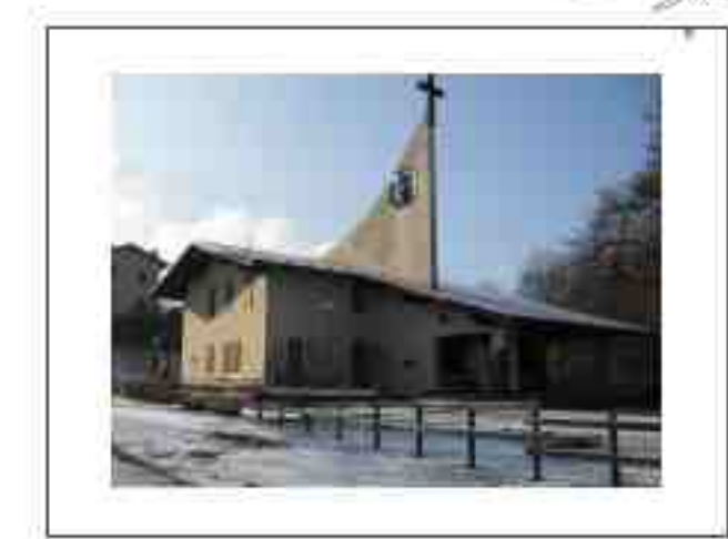
Chiesa di Monte Croce