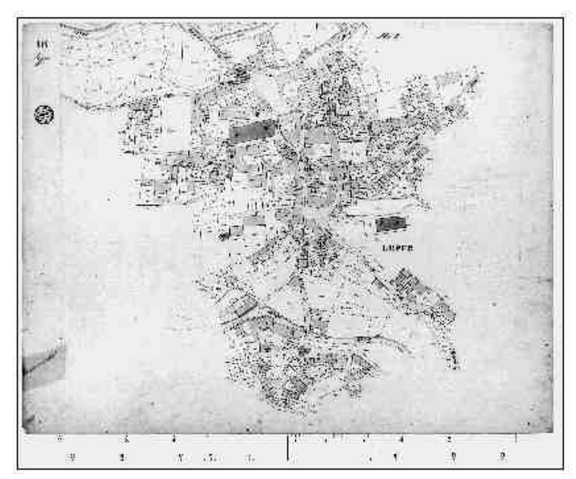
MAPPA DEL COMUNE CENSUARIO DI LEFFE DISTRETTO XV. DI GANDINO PROVINCIA DI BERGAMO RETTIFICATA NELL'ANNO 1844