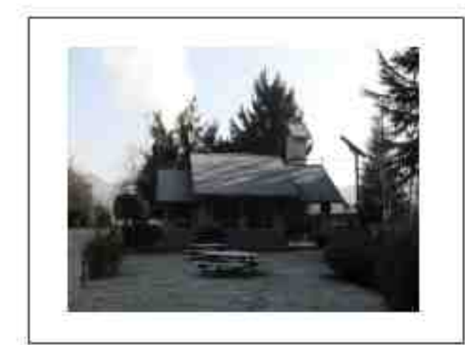
Cappella degli Alpini