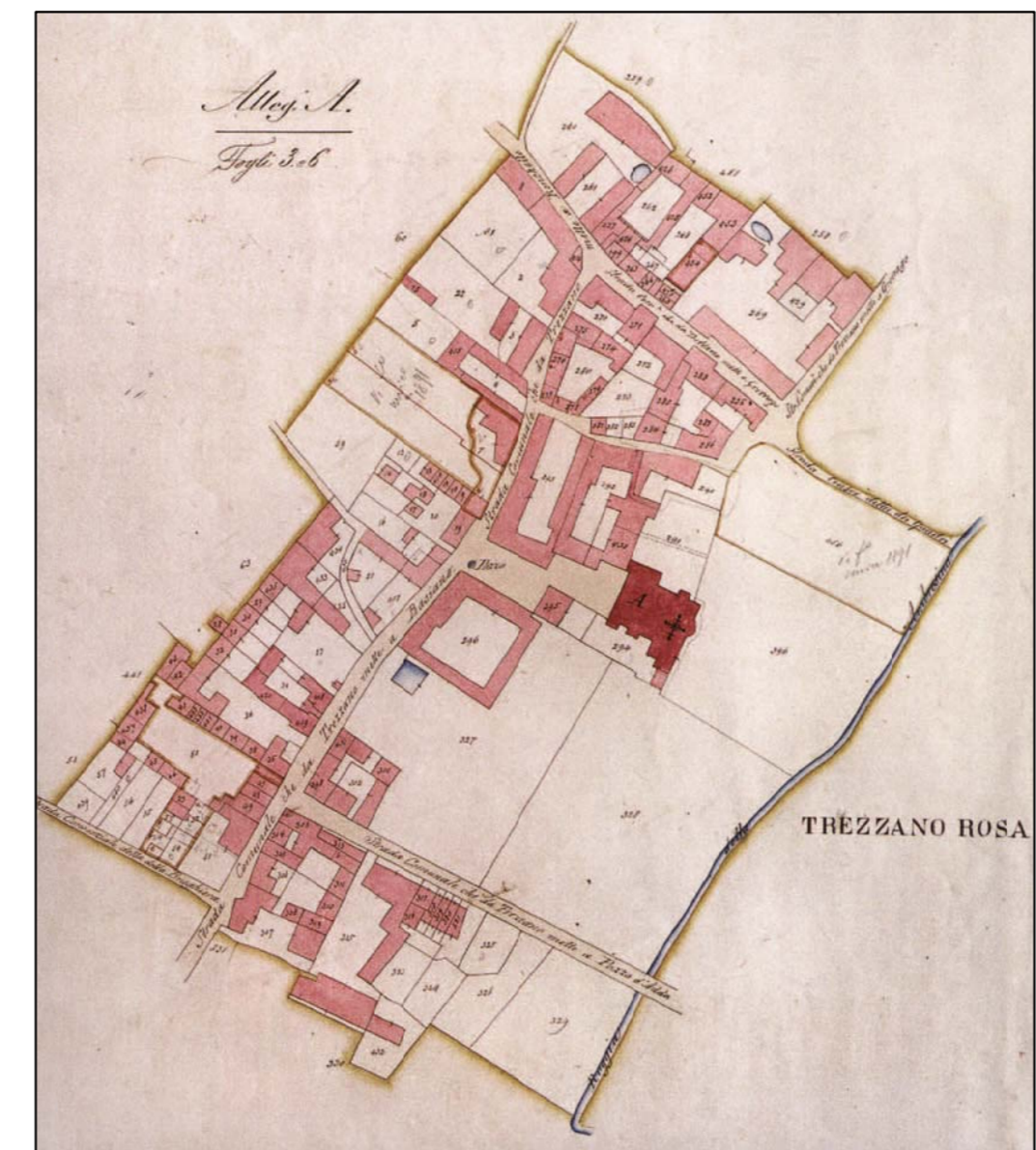
CATASTO LOMBARDO VENETO - 1887 - PARTICOLARE DEL NUCLEO CENTRALE ABITATO (RIPRODUZIONE NON IN SCALA)